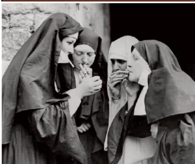
Pauză de fumat, Anglia, 1960