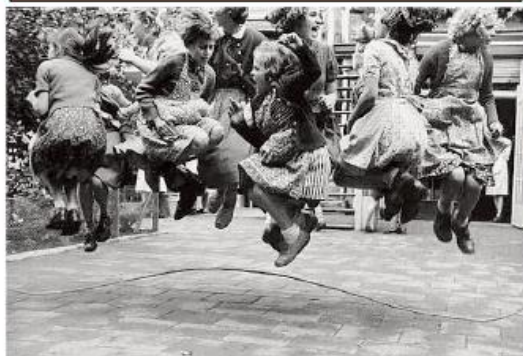
Tinerele germane practicând săritul corzii, 1950