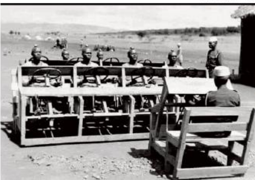
Școală de șoferi în Africa de Sud, 1943